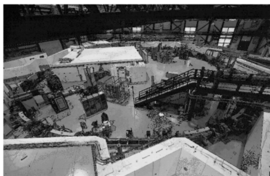
Figure 1. Picture of ANKA light source.

ANKA 社はカールスルーエ研究センターからの出資により設立された会社です。ただし最近, ANKA 社は完全な民間会社になるべきだとか, カールスルーエ研究センターが完全に所有すべきだとか, 運営に関して国や州との間で色々議論されているようです。目下のところ, ANKA 社は, 施設の運転と工業利用や企業からの利用研究の受け入れを行い, カールスルーエ研究センター本体は同研究センターおよび他の研究所の基礎研究を担当するという役割分担になっています。したがって ANKA 社自身はマイクロマシンの微細加工と分析業務を行うだけでなく, ビームラインを民間企業の利用に供する事になっています。その際1時間当たりの費用は450マルクです。利用研究分野として環境科学, 化学工学, 構造生物学などが挙