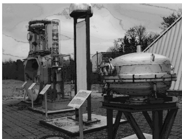
Figure 1. The first grazing incidence monochromator of F41, DESY, used since 1966. Now it is exhibited as a monument in front of XFEL laboratory of HASYLAB.

世界の放射光研究は1963年にアメリカはワシントン DC にあった National Bureau of Standards, NBS (今日の National Institute of Standards and Technology, NIST) の 180 MeV 改造シンクロトロンでスタートし、日本 (1963) とドイツ (1964) がそれに続いた。NBS は移転のため間もなく活動を停止してしまい、60年代後半に目覚しく活